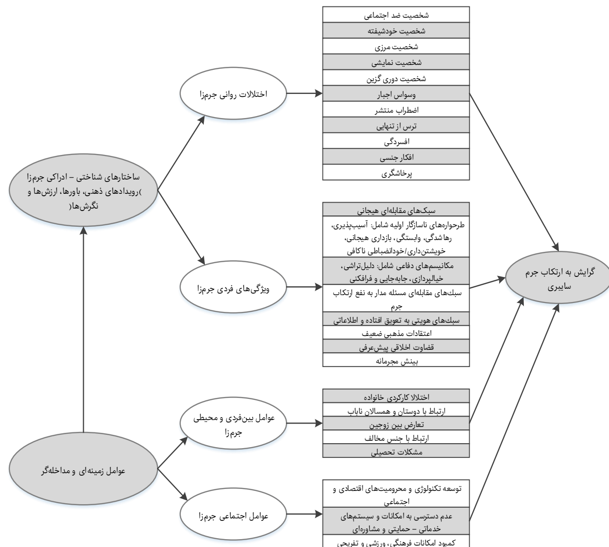
شکل ۲) مدل مفهومی توسعه‌یافته ساختارهای شناختی- ادراکی جرم‌زا در مجرمان سایبری بر اساس تحلیل روایت زندگی آنان

لازم به ذکر است کدگذاری مصاحبه‌ها در ۳ قسمت مؤلفه-های اصلی، مؤلفه‌های فرعی و زیر مقوله‌های ساختارهای شناختی- ادراکی مجرمان سایبری استخراج شد که نتایج حاصل نشان داد این ساختارهای شناختی- ادراکی شامل اختلالات روانی (از جمله اختلالات شخصیتی، اختلالات اضطرابی، اختلالات خلقی، اختلال جنسی، پرخاشگری)، سبک‌های مقابله با مشکلات، سبک‌های هویتی، طرح‌واره‌های ناسازگار اولیه (شامل آسیب-پذیری، وابستگی، رهاشدگی، بازداری و خویش‌نشان‌داری/ خود انضباطی ناکافی)، مکانیسم‌های دفاعی (شامل دلیل‌تراشی،