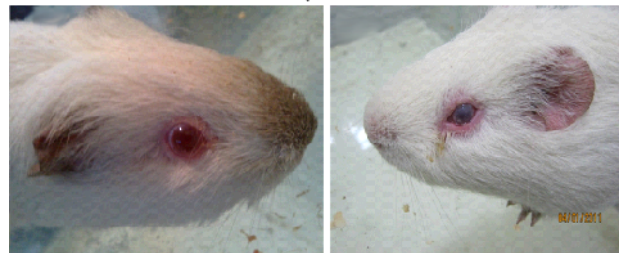
شکل ۲. بررسی قدرت تهاجم سویه زنده ضعیف شده تولید شده در نتیجه حذف نسخه پلاسمیدی ژن ipad از باکتری شیگلا الف- نمونه‌ای از خوکچه‌هایی که به وسیله سویه وحشی آزمون شده بودند که بروز ورم ملتحمه چشم را نشان می‌دهند. ب- نمونه‌ای از خوکچه‌هایی که به وسیله سویه زنده ضعیف شده آزمون شده بودند که ورم ملتحمه چشم را بروز ندادند.