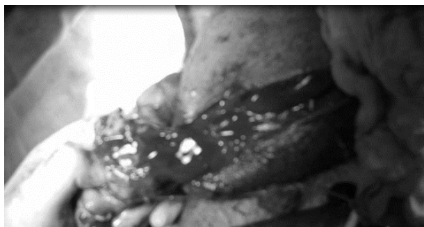
شکل ۴: اریکتومی راست

مطالعات، از ۹۷ نفر ترومای بیضه به دنبال تیرخوردگی، در ۲۴ نفر منجر به برداشتن بیضه شده بود. همچنین ۱۰ نفر همزمان دچار آسیب به مجرای ادراری و کورپورا کاورنوزوم (آلت) شده بودند [۹]. در بررسی شش ساله تروماهای ماژور دستگاه تناسلی شافی و همکاران در ایران نشان دادند، ۴۹٪ صدمه به پنیس وجود داشته که ۱٪ مورد قطع پنیس و بیضه و ۱/۸٪ صدمه به اسکروتوم گزارش شده است [۸].