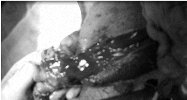
شکل ۴: اریکتومی راست

مطالعات، از ۹۷ نفر ترومای بیضه به دنبال تیرخوردگی، در ۲۴ نفر منجر به برداشتن بیضه شده بود. همچنین ۱۰ نفر همزمان دچار آسیب به مجرای ادراری و کورپورا کاورنوزوم (آلت) شده بودند [۹]. در بررسی شش ساله تروماهای ماژور دستگاه تناسلی شافی و همکاران در ایران نشان دادند، ۴۹٪ صدمه به پنیس وجود داشته که ۱٪ مورد قطع پنیس و بیضه و ۱/۸٪ صدمه به اسکروتوم گزارش شده است [۸].