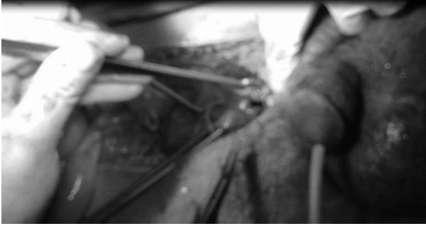
شکل ۲: ترمیم پارگی مثانه

دبریدمان قسمت‌های آسیب‌دیده، ترمیم مجرا بصورت، انتها به انتها انجام و اجسام کاورنوزا و اسپونژیوز ترمیم شد (شکل ۳). عروق نرمال بود. بعد از لیگاتور قاعده پنیس، ارکشن مصنوعی بطور کامل انجام شد. سوند سیستوستومی و سوند مجرا (فولی شماره ۱۸) گذاشته و سپس با توجه به تخریب بیضه راست، ارکیکتومی راست انجام گردید (شکل ۴). بیضه چپ پارگی نداشت فقط ایسکمیک بود که با گرم کردن بهتر شد. بعد از آن تونیکا واژینالیس و پوست و جدار ترمیم گردید و بیمار به ریکاوری منتقل شد. بیمار دو روز در آی سی یو و ۷ روز در بخش جراحی تحت درمان با آمپول سفتریاکسون وریدی ۱ گرم هر ۱۲ ساعت و آمپول مترونیدازول وریدی ۵۰۰ میلی گرم هر ۸ ساعت قرار گرفت و سپس با سوند مجرا و سوند سیستوستومی مرخص شد. سوند سیستوستومی یک ماه بعد ترخیص برداشته شد. یک و سه ماه بعد از ترخیص سیستوسکوپی کنترل انجام شد که تنگی مجرا وجود نداشت. پیگیری ۷ ماهه نشان داد که بیمار مشکل ادراری نداشت و دارای ارکسیون و فعالیت جنسی طبیعی نیز می‌باشد.