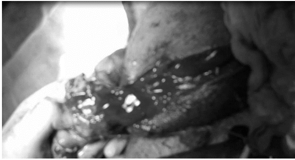
شکل ۴: اریکتومی راست

مطالعات، از ۹۷ نفر ترومای بیضه به دنبال تیرخوردگی، در ۲۴ نفر منجر به برداشتن بیضه شده بود. همچنین ۱۰ نفر همزمان دچار آسیب به مجرای ادراری و کورپورا کاورنوزوم (آلت) شده بودند [۹]. در بررسی شش ساله تروماهای ماژور دستگاه تناسلی شافی و همکاران در ایران نشان دادند، ۴۹٪ صدمه به پنیس وجود داشته که ۱٪ مورد قطع پنیس و بیضه و ۱/۸٪ صدمه به اسکروتوم گزارش شده است [۸].