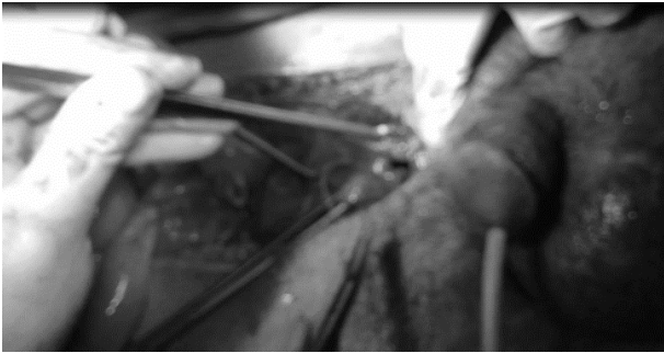
شکل ۲: ترمیم پارگی مثانه

دبریدمان قسمت‌های آسیب‌دیده، ترمیم مجرا بصورت، انتها به انتها انجام و اجسام کاورنوزا و اسپونژیوز ترمیم شد (شکل ۳). عروق نرمال بود. بعد از لیگاتور قاعده پنیس، ارکشن مصنوعی بطور کامل انجام شد. سوند سیستوستومی و سوند مجرا (فولی شماره ۱۸) گذاشته و سپس با توجه به تخریب بیضه راست، ارکیکتومی راست انجام گردید (شکل ۴). بیضه چپ پارگی نداشت فقط ایسکمیک بود که با گرم کردن بهتر شد. بعد از آن تونیکا واژینالیس و پوست و جدار ترمیم گردید و بیمار به ریکاوری منتقل شد. بیمار دو روز در آی سی یو و ۷ روز در بخش جراحی تحت درمان با آمپول سفتریاکسون وریدی ۱ گرم هر ۱۲ ساعت و آمپول مترونیدازول وریدی ۵۰۰ میلی گرم هر ۸ ساعت قرار گرفت و سپس با سوند مجرا و سوند سیستوستومی مرخص شد. سوند سیستوستومی یک ماه بعد ترخیص برداشته شد. یک و سه ماه بعد از ترخیص سیستوسکوپی کنترل انجام شد که تنگی مجرا وجود نداشت. پیگیری ۷ ماهه نشان داد که بیمار مشکل ادراری نداشت و دارای ارکسیون و فعالیت جنسی طبیعی نیز می‌باشد.