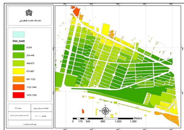
شکل ۳: اصله مراکز درمانی تا سایر قسمت های محله مورد

جهت تعیین نوع سازه با توجه به عدم وجود شناسنامه فنی برای ساختمان ها در کشور ایران، در مواردی که اطلاعاتی موجود نبود، با استفاده از مشاهده و در مواردی مشورت با متخصصین سازه تکمیل اطلاعات انجام گرفت. جهت بررسی ایمنی شبکه ارتباطی عواملی نظیر عرض معبر، واقع شدن مراکز درمانی در راه های شریانی و امکان برقراری ارتباط با شبکه های خارج شهر، وجود عوامل ناپایدار در مسیر و همچنین وجود خطر نشست زمین در زمان زلزله و تطابق