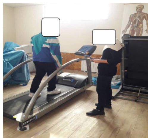
شکل (۲) تست بروس تعدیل‌شده با تردمیل