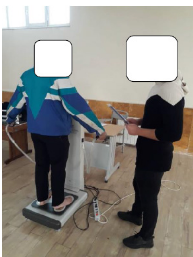
شکل ۱) اندازه‌گیری فاکتورهای آنتروپومتریکی با استفاده از دستگاه آنالیز ترکیب بدنی

اندازه‌گیری آنتروپومتریکی: با استفاده از دستگاه آنالیز ترکیب بدن (Composition Body) مدل body 220 In ساخت کشور کره جنوبی مورد بررسی قرار گرفت (شکل ۱). این دستگاه درصد کل چربی بدن و شاخص توده بدنی (BMI) و نسبت دور کمر به لگن (WHR) را اندازه می‌گیرد که بر اساس شاخص توده بدنی، کمتر از ۲۰ لاغر، ۲۰ تا ۲۵ طبیعی، ۲۵ تا ۳۰ اضافه وزن و بیش‌تر از ۳۰ چاق محسوب می‌شود [۱۱]. همچنین بر اساس تفسیر نسبت دور کمر به لگن، اگر این شاخص بالاتر از ۰/۹ در مردان به‌دست آید، به عنوان یک فاکتور خطر برای سلامتی است [۱۱].