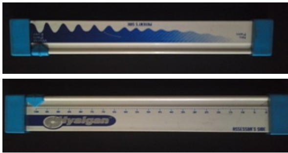
تصویر ۱: مقیاس درد (VAS)

کمردرد قرار می‌گیرند. نمره آیت‌های مختلف با هم جمع و بر عدد ۵۰ تقسیم و در عدد ۱۰۰ ضرب می‌شود تا درصد ناتوانی به دست آید [۱۸].