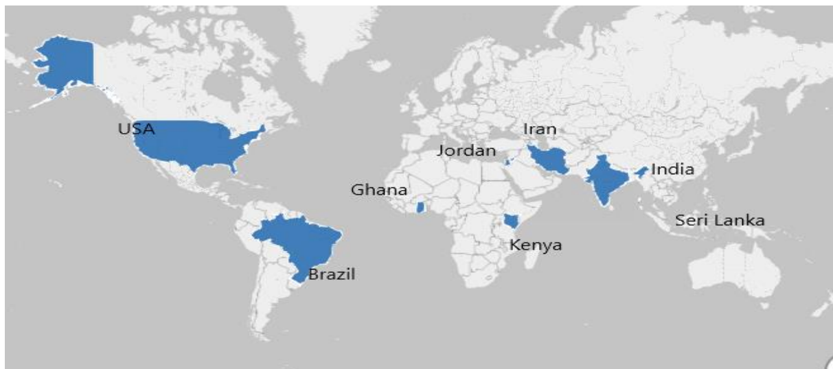
شکل ۲) نقشه پراکندگی مستندات اعتباربخشی بیمارستان‌ها و مراکز مراقبتی نظامی

مطابق با جدول ۱، ۱۶ مطالعه وارد بررسی نهایی شدند که نه مقاله و هفت گزارش و مستند را دربر می‌گرفت. از جمله مراکز مراقبت سلامت نظامی که از اعتباربخشی جهت بهبود وضعیت خود استفاده نموده‌اند مرکز پزشکی ارتش سه‌گانه، بیمارستان یادبود نیروهای دفاعی کنیا و بیمارستان کولومبو سریلانکا بودند. سایر یافته‌های مطالعه حاضر نشان داد که محققین و سیاست‌گذاران بیمارستان‌ها و مؤسسات مراقبت بهداشتی نظامی در اعتباربخشی خود از ابزارها و استانداردهایی نظیر JCAHO، ISO، NCQA، ابزار اعتباربخشی طراحی شده و مدل ملی اعتباربخشی استفاده نموده‌اند که در شکل ۱ نمایش داده شد. کمیته ملی تضمین کیفیت آمریکا (NCQA) کمیته‌ای است که تضمین کیفیت مراقبت‌ها و وظیفه اصلی آن است و اعتباربخشی مراکز مراقبت بهداشتی درمانی نیز جز وظایف آن است.