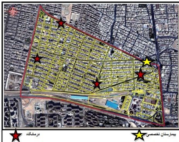
شکل ۱: موقعیت استقرار مراکز درمانی در محله مورد مطالعه

RVS نامیده می شود، استفاده شده است. این روش از گروه روش های ارزیابی کیفی است که به شیوه «امتیاز بندی» و با هدف تشخیص و ارزیابی وضعیت ساختمان های قدیمی که به طور مناسب در برابر نیروی زلزله ایستادگی ندارند، ساختمان هایی که زمین های ضعیف با خاک سست بنا شده اند و نیز ساختمان هایی که ویژگی اجرایی آن ها به گونه ای است که به طور مناسب در برابر زلزله واکنش نخواهند داشت به کار می رود [۱۴]. با توجه به خطر پذیری بالای تهران در برابر زلزله از فرم RVS